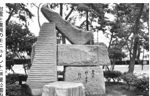
慰霊と復興のモニュメント(芦屋公園内)