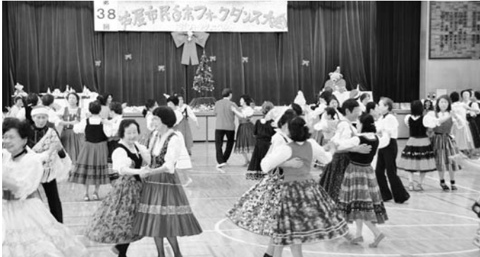
市民年末フォークダンス大会が開催されました 12月25日(火)精道小学校体育館では、華やかな衣装の参加者が集まり、世界のフォークダンスを楽しみました。

発行/ 芦屋市役所(広報課) TEL. 0797-31-2121/FAX. 0797-38-2152 〒659-8501兵庫県芦屋市精道町7番6号 ホームページ http://www.city.ashiya.lg.jp/ メールアドレス info@city.ashiya.hyogo.jp