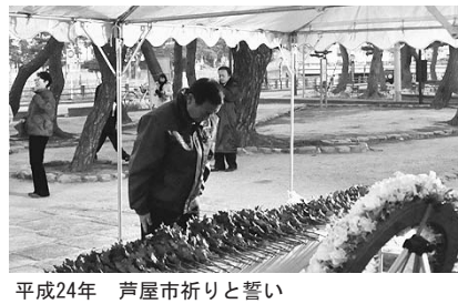
平成24年 芦屋市祈りと誓い