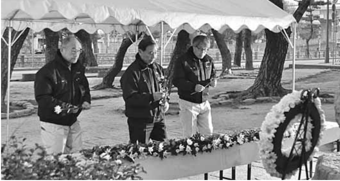
震災18年「1.17芦屋市祈りと誓い」で献花を行いました 1月17日(木)芦屋公園「慰霊と復興のモニュメント」前に1,195人が訪れ、阪神・淡路大震災で犠牲となったかたへ冥福を祈りました。

発行/ 芦屋市役所(広報課) TEL. 0797-31-2121/FAX. 0797-38-2152 〒659-8501兵庫県芦屋市精道町7番6号 ホームページ http://www.city.ashiya.lg.jp/ メールアドレス info@city.ashiya.hyogo.jp