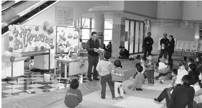
ウィザスあしやフェスタ2013が開催されました 3月3日(日)、男女共同参画センターでは、ステージでのイベントやバザーなど、さまざまな催しが行われました。

発行/ 芦屋市役所(広報課) TEL. 0797-31-2121/FAX. 0797-38-2152 〒659-8501兵庫県芦屋市精道町7番6号 ホームページ http://www.city.ashiya.lg.jp/ メールアドレス info@city.ashiya.lg.jp