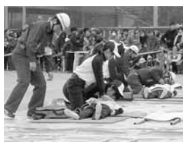
消防出初め式 救急模擬演技 (平成25年)