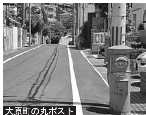
大原町の丸ポスト

本市としましてはこの特集を通して、美しい町並みを守り残すために、さりげなく努力する芦屋市民の気質と積み重ねが、芦屋の魅力につながっていると伝えられたのではないかと思います。なお、この特集は平成二十四年二月後半の「あしやトライあんぐる」で放映しました。DVDの貸し出しは予約が必要ですが、事前に広報課までお問い合わせの上、お越しください。