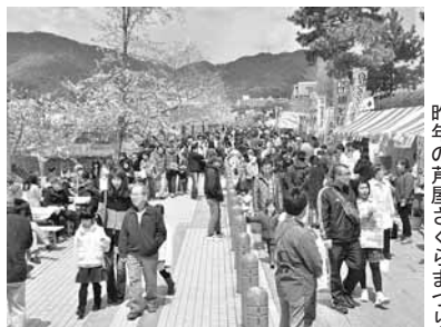
昨年の芦屋さくらまつり

まつりボランティア募集 当日の運営補助・清掃等をお手伝いいただけるかたは、下記へ *当日も、ボランティアテントで受け付けています。