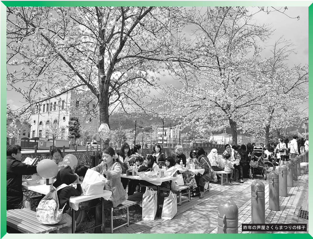
昨年(2012年)の芦屋さくらまつりの様子

発行/ 芦屋市役所(広報課) TEL. 0797-31-2121/FAX. 0797-38-2152 〒659-8501兵庫県芦屋市精道町7番6号 ホームページ http://www.city.ashiya.lg.jp/ メールアドレス info@city.ashiya.lg.jp