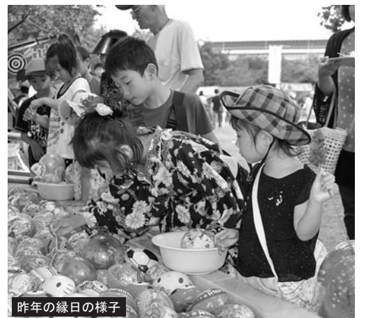
昨年の緑日の様子