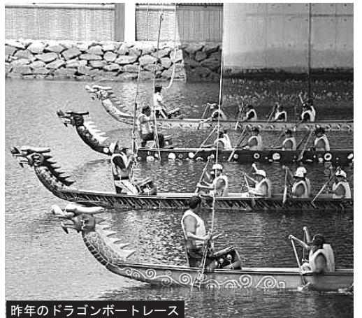
昨年のドラゴンボートレース