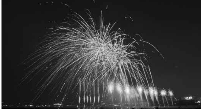
“第35回 芦屋サマーカーニバル”が開催されました 7月27日(土)、夏らしい天候に恵まれ、昨年より多い約115,000人のかたがたが、緑日や市民ステージ・花火を楽しみました。

発行/ 芦屋市役所(広報国際交流課) TEL.0797-31-2121/FAX.0797-38-2152 〒659-8501兵庫県芦屋市精道町7番6号 ホームページ http://www.city.ashiya.lg.jp/ メールアドレス info@city.ashiya.lg.jp