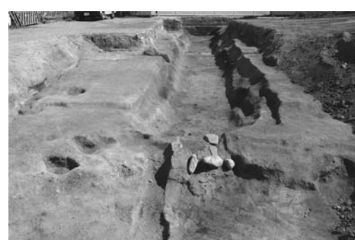
写真3：今年、寺田遺跡で発掘された堀跡

上の堀が2本造られていました(堀1・堀2)。そのうち、今回新たに発掘したのは南側の堀2で、東西30メートルの長さを確認しました(写真3)。この堀を掘る