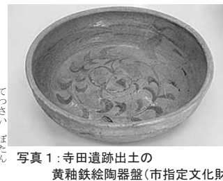
写真1：寺田遺跡出土の黄釉鉄絵陶器盤(市指定文化財)

一方、今回の発掘調査地からおおよそ70メートル西方の西芦屋町で実施した寺田遺跡の発掘調査では、冒頭でも触れた12世紀後半ごろに中国華南で生産され輸入された大変珍しい黄釉鉄絵陶器盤(写真1)が出土しています。大きさは、直径35センチメートル程です。直径30センチメートルの穴の中から粉々に割られた破片の状態で見つかりました。直徑30センチメートル程です。直徑30センチメートル程です。直徑30センチメートル程です。