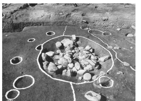
写真2：月若遺跡で発掘された井戸跡

平清盛が活躍した時代(12世紀終わりごろ)、中国の宋との貿易が盛んに行われていました。この日宋貿易をさらに推し進めるため、清盛は九州の大宰府(福岡県)をおさめ、博多の港湾施設を充実させるとともに、畿内における宋船の入港の一大拠点として大輪田泊神戸市兵庫区の修築を急ぎました。