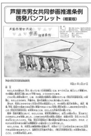
パンフレット表紙

市では、男女が互いにその人権を尊重しつつ、責任も分かち合い、性別にかかわらず個性と能力を十分に発揮し、さまざまな分野に参画できる社会の実現を目指して、平成21年3月に芦屋市男女共同参画推進条例を制定し、男女共同参画の推進を市の主要な施策として位置付け、各施策に取り組んでいます。このたび、条例啓発パンフレット(概要版)を改訂し作成しました。「男女共同参画ってなあに?」ということが分かりやすいパンフレットになっています。市立中学校の生徒の皆さんや、男女共同参画センター事業・講座への参加者に配付するほか、希望されるかたにも男女共同参画センターで配布します。市ホームページにも掲載していますので、ぜひご覧ください。