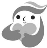
犯罪被害者等支援シンボルマーク「ギョッとちゃん」