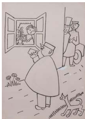
ヨゼフ・チャペック 『長い長いお医者さんの話』より 『郵便屋さんの話』(挿絵・原画)1932年

どこか懐かしさを感じさせる手作り感と、洗練されたデザインで人気を集めるチェコの絵本。本展では、絵本原画や制作過程の資料、絵本など約150点を通して、チャペック兄弟などチェコ絵本の伝統を築いた草創期の巨匠から、旅絵本『ジス・イズ・プラハ』を手がけたミハエラ・クヴィチョヴァー、近年、注目を集めているアルジュビェタ・スカーロヴァーなど最新鋭の作家たちの創作まで、その幅広く奥深い魅力をご紹介します。