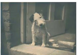
カレル・チャペック『ダーシェンカ、 あるいは仔犬の生活』(写真)1932年