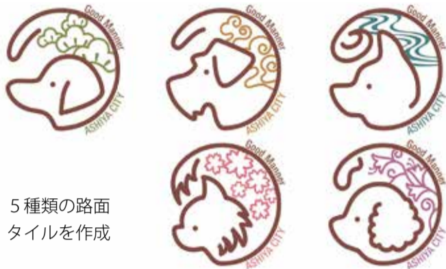
5種類の路面 タイルを作成

コミュニティ道路へ「犬のふん放置禁止」看板に替え、路面タイルを集中的に設置。「お散歩マナー向上モデルロード」として、周知することで違反行為を抑止し、まちの魅力アップにつながる取り組みを行います。