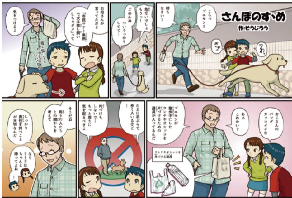
発行：芦屋市役所市民生活課環境課 ☎797-35-2050 協力：神戸芸術工科大学 まんが表現学科

4月から環境課(本庁舎北館3階)・ラポルテ市民サービスコーナーでも配布しています。