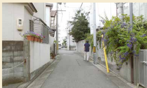
西国街道の現在の様子(茶屋之町)

芦屋は、古くから東西交通の重要な場所でした。古代には都と大宰府(福岡県)を結ぶ山陽道が通り、江戸時代には、山陽道を基にした、西国街道が通っていました。