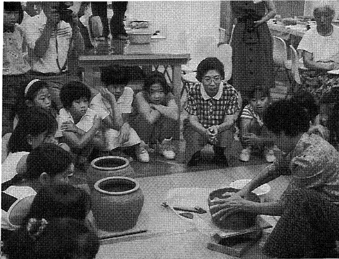
タイの土器づくり教室(市立美術博物館で)

「習う側の立場に立った教育の実現」を基本理念とした本年度の市教育委員会主要施策の概要をお知らせします。