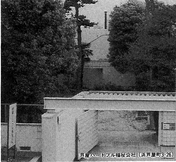
芦屋ハートフル福祉公社 (浜芦屋町3-26)

発行／芦屋市役所(公聴広報課) ☎0797-31-2121 〒659 兵庫県芦屋市精道町7番6号