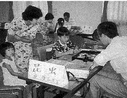
夏休みに採集した植物・昆虫を持ってきてください

夏休みの自由研究などで採集した植物や昆虫の名前を調べたい小・中学生のために開催します。 ▼日時：八月三十日(日) 十時～十六時 ▼会場：打出教育文化センター大会議室