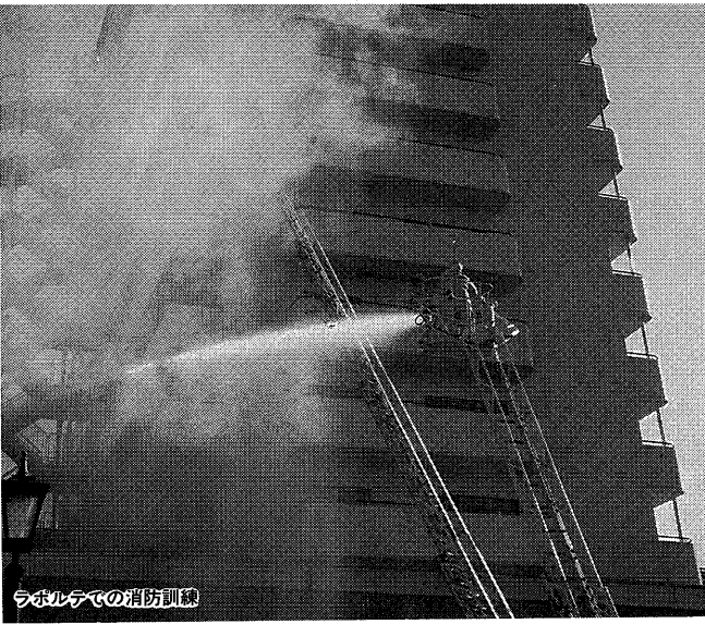
ホテルでの消防訓練

また昨年は、放火が三件もありました。放火犯人は、季節を選ぶことなく、人の目の届きにくい所、スキがある所等を狙って火を放ちます。皆さんもお互いに注意し、目を配りあつて、火災を防ぎましょう。なお、昨年の火災件数は二十五件で、火災種別件数