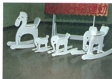
高浜分署に子馬とゾウさんの作品が登場

十一月九日から十五日の間に「火災予防運動」が展開されました。それに合わせ作成されたのですが、これらは分署長が昼休みや勤務時間後に廃材を利用して作ったそうです。「子馬やぞうさんで子供達の気を引き、火の用心といふことを小さい頃から覚えておいてもらいたい」と、廃材利用は、物を大切に育てば、と、想いを語ってくれました。その他にも、まとい型ちようちゃんや昨年末に作った六面体のあんどん等も展示、道行く人達の目を惹かせています。