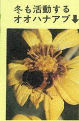
ヨモギハムシ↑ 冬も活動するオオハナアブ↓