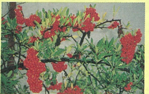
ピラカンサ(タチバナモドキ)の実 野鳥の餌の少なくなる冬の季節に目立つ実を付けて鳥の餌になり、実の中の種子を肥料付きで撒いてもらう植物たちも多々あります。

野鳥の餌の少なくなる冬の季節に目立つ実を付けて鳥の餌になり、実の中の種子を肥料付きで撒いてもらう植物たちも多々あります。餌を丸呑みにする鳥は、実だけ消化して種子は糞と共に出すからです。庭木のナンテン、ピラカンサ、街中の野生植物ではノイバラやヘクソカズラなどはこの戦略をとっています。キク科のように冬の強風を利用して遠くに飛ばされ、分布を広げるものもあります。