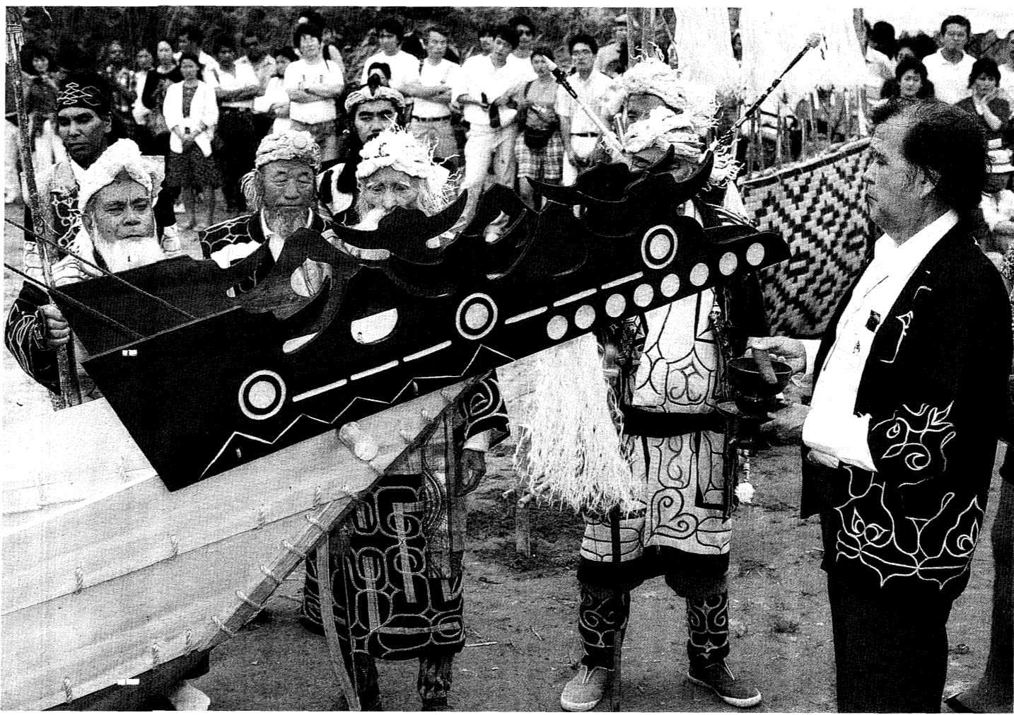
200年ぶりに復元されたアイヌのイタオマツ(板敷船)の進水式。交易船として活躍した