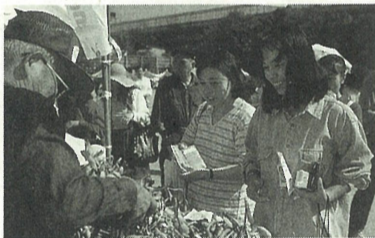
賑わう秋まつり(上:篠山町からの縁日)

十月十三日、精道小学校を会場に第八回あしや秋まつりが行われ、延べ六万人の参加者がありました。今年には復興への意気込みを示すように「だんじり」「こどもみこし」が「はりもーってんサ」のかけ声も勇ましく二年ぶりに復活しました。会場では二十余りの縁日が