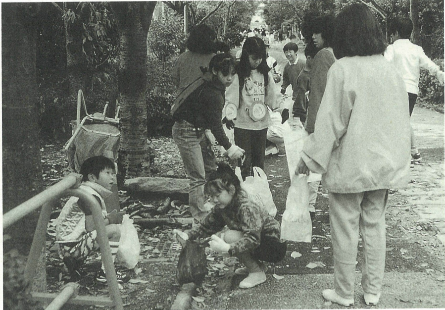
約600人が参加したふれあいクリーンウォーク（浜風小学校区）