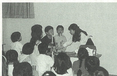
お話を聞き終えて（図書館おはなしのへや）

◆「友の会」の設立 ボランティアとして点字図書、録音図書、映像資料の作成 ◆「友の会」の設立 ボランティアとして点字図書、録音図書、映像資料の作成