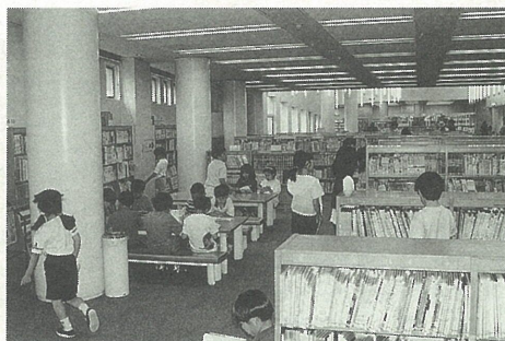
子どもたちにぎわう図書館

図書館本館は、昭和六十二年七月八日に旧図書館（現在の図書館打出分室）から伊勢町に移転し開館しました。新図書館の開館後、利用者は飛躍的に伸び、幼児から高齢のかたまで、市民に親しまれる図書館として発展してきました。平成八年度は一日平均四五三人が千八百二十七冊、市民一人当たり七・三冊（全国平均三・七冊）の本を借りられました。 この十年の歩みを振り返ってみました。