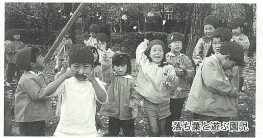
落ち葉と遊ぶ園児

芦屋市で最も南の幼稚園です。最近、湾岸道路の南側に建築中の住宅がたくさん見えるようになりました。園児の大半は高層に住んでいるので、