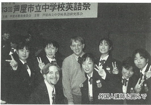
外国人講師を囲んで