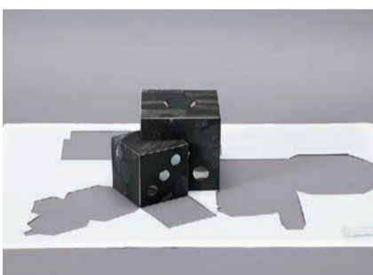
Charcoal/A Couple of Dice 2013年