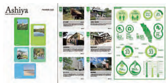
A4判・観音開き・8ページ