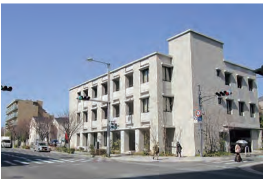
渡辺産婦人科小児科