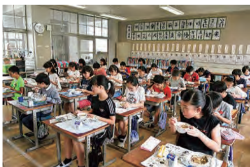
朝日ヶ丘小学校 給食の様子