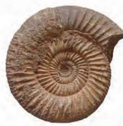
アンモナイトの化石

化石の展示や化石に関するお話、落ち葉や木の枝を使った工作、折り紙などで楽しく自然について勉強しましょう。