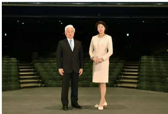
芦屋市議会議長 松木義昭(左) 芦屋市長 いとうまい(右)

増を目指し、総合計画や創生総合戦略の基本方針「未来の創造」を積極的に取り組む体制を構築するため、部の改編などの機構改革を行います。