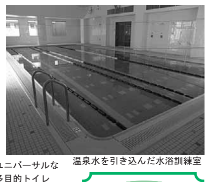
ユニバーサルな多目的トイレ 温泉水を引き込んだ水浴訓練室