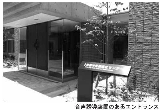
音声誘導装置のあるエントランス