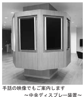
手話の映像でもご案内します ~中央ディスプレイ装置~

さまざまな情報等をタイムリーに提供しています。 4 あしや温泉の温泉水を、水浴訓練室に引き込み利用します。館内と施設周囲の清掃を市内外の作業所をお願いしています。