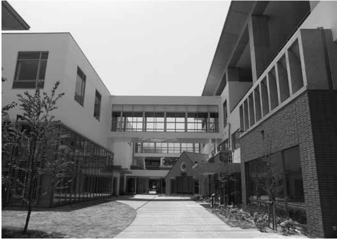
保健福祉センター全景

■発行/ 芦屋市役所 ☎ 31-2121 〒659-8501 芦屋市精道町7番6号 ■問い合わせ 芦屋市保健福祉センター ☎31-0612/☎31-0614(7月20日以降) 〒659-0051 呉川町14番9号 ■ホームページ http://www.city.ashiya.lg.jp