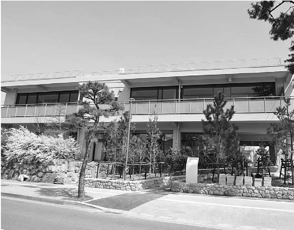
4月15日(月)に業務を開始する男女共同参画センター ウィザスあしや(1階)あしや市民活動センター リードあしや(2階)

■問い合わせ 市民参画課 ☎38-2007 男女共同参画センター ☎38-2023