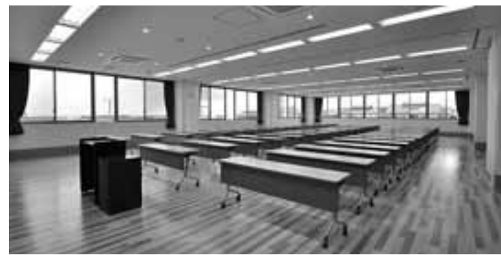
多目的室(201室・202室・203室の一体利用)

相談室 国際交流を深めるために、外国語や外国の文化を学びませんか？ さまざまな講座や催し物も開催します。日本人が外国語や外国の文化を学び、外国人が日本語や日本の文化を学ぶ場として、国際交流センターをご利用ください。