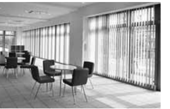
1階・オープンスペース