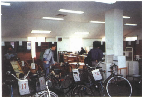
問い合わせ 環境施設課 ☎32-5391

自転車、家具類などリフォーム可能な資源を大型ごみの中から回収し、リフォーム後、再生品として市民の皆様へ再提供いたします。今年度は既に3月と5月に実施しました。この事業は、年間4回程度行う予定です。