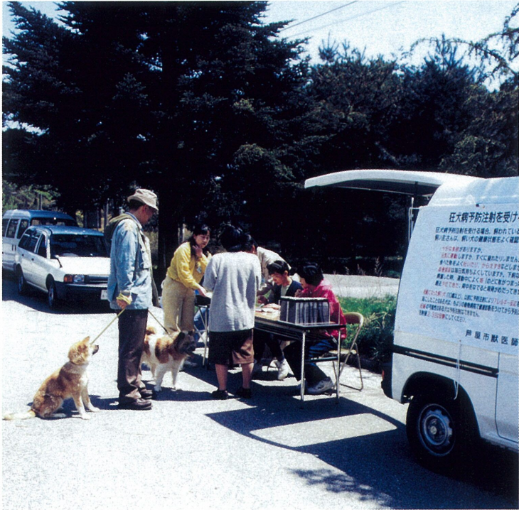
平成9年度 犬の登録及び狂犬病予防集合注射(4月)

自治会の方やボランティアの方が、清掃活動をしておられますが、なによりも「汚さない」ことが基本です。