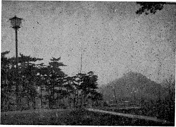
現しつゝありますが、今度...