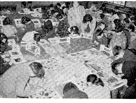
作品の仕上げに懸命な児童