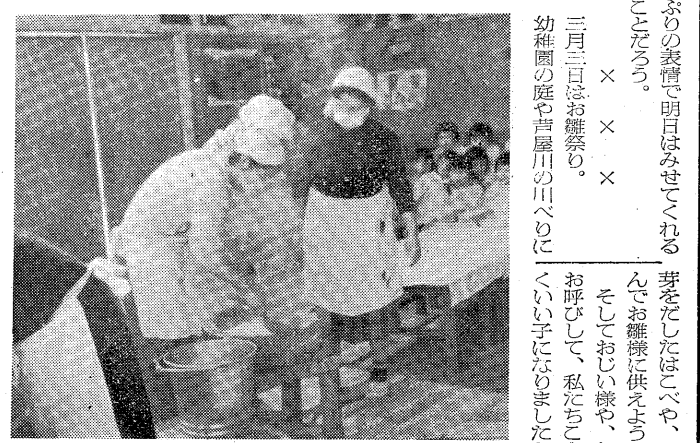
う れ し い お も ち つ き