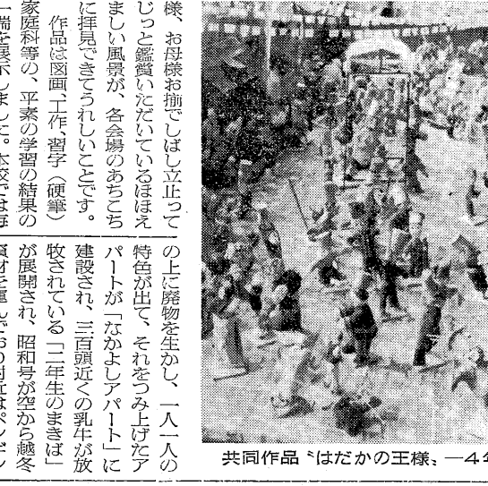
共同作品「はだかの王様」-4年生