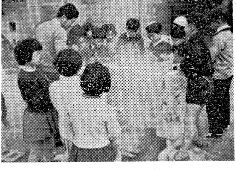
樂焼の出来上りを楽しむ児童