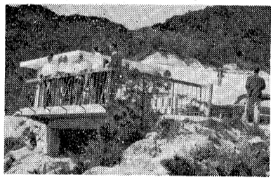
朝日ヶ丘町にある日本一の景勝地公園に、新しい展望台が完成しました。これは、公園の最も高い標高四百四十メートルで、芦屋市内にはもう大阪神宮が一望に展望できます。工費は三十三万円で、鉄筋コンクリートの屋根つき休憩所と見晴し台があり、絶景の展望台です。一度ご家族づれにおいでください。

三年ごとに行なわれる外人登録証明書の大量切替時期がきました。今回切替えになるのは、昭和三十一年十月から十一月までに新しく外人登録証明書を受けた人約三百人で、市内に在住する外国人の半数はこれに当たります。該当者は現行の証明書に記載されている期限満了日前三十日以内に申請をして新しい証明書をもらってください。