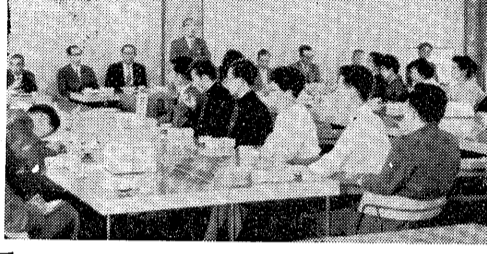
「白い羽根」目標、ことしも五月を32%も突破、一日から全国いっせいに赤十字運動が展開されました。本市でも、みなさんの協力で、本年目標額四九六、七〇〇円に対し、六五九、一三八六、六〇〇円を達成し、この功績をたたえ、好成績を納めることができました。厚くお礼申し上げます。

人は、日本国内に住所を有する二十歳以上六十歳未満の日本国民であれば全部加入しなければなりません。 二、ただし、厚生年金保険、共済組合の組合員、遺族年金、遺族給付金、恩給などの公的年金の被保険者、組合員や受給者、または受給資格を有する人及びこれらの該当者の配偶者、学生は適用されません。(未項参照) 三、保険料は、二十歳から三十四歳までが月額百円、三十五歳から五十九歳までが月額百五十円です。