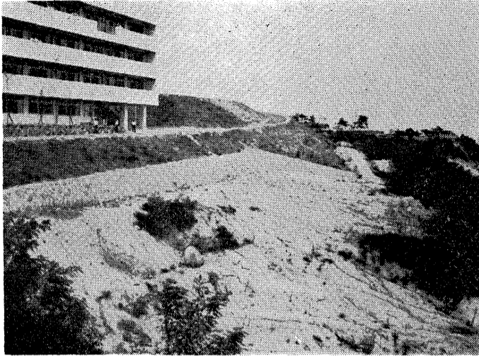
体育館が建設される本館前の敷地

川西町の仮校舎をスタートした市立芦屋高校が、朝日ヶ丘町にできた本校舎へ移ったのは昨年四月のこと。そして、これまた待望の体育館を新築することになり、もう着工を待つばかりになっています。この新施設には講堂を兼ねる体育館はかりでなく、一階に三つの特別教室が設けられ、すから、いままで普通教室として利用していた本館の三特別教室が本来の目的に専用できるわけ、完成後の学習成果に大きな期待が寄せられています。