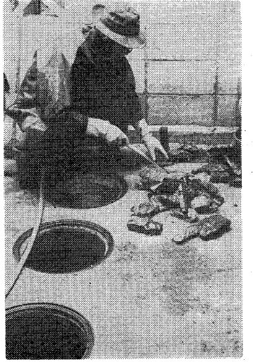
浄化そのはいつも完全な状態に

作業車には図のような許可マークをつけています。作業は清掃基準に基づいて良心的に行なうことが