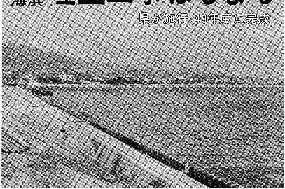
神戸市の東部で進められている埋立地から見た芦屋の海浜

本市の海浜百二十八万平方メートルを埋立て、新しい市街地、芦屋らしい市街地を造成しようとする埋立事業は、いよいよ先月末から工事に切りかかりました。着工第一段階のこの工事は、埋立地最先端の護岸部分(下図の斜線の部分)にあたる海底のヘドロ層を取り除き、良質の土砂と置