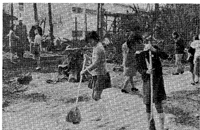
本館に不幸中の幸いだったと申すよりほかにありません。今後、全学

校園のすべての対策について検討し、強化していきますが、ここに緊急対策と復旧対策を報告し、重ねてお呼びを申しあげます。