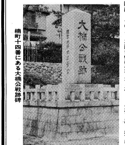
楠町十四番にある大楠公戦跡碑

永正八年(一五二一年)時の管領細川両家の実権争奪をめぐる地方勢力も二分し、芦屋地方に勢力を持つ土豪(どこう)瓦林正頼は、細川高国方に味方して、鷹尾城(城山)を構え勢力をふるった。いつづ、細川澄元(すきもと)方の淡路の部將細川尚春は、鷹尾城攻めのため兵庫へ上陸、軍勢を