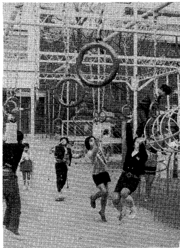
男女共学は男女が互いの特性を理解し合う有効な場

子どもに「赤ちゃんはどこから生まれるの?」と聞かれたらどう答えるらうか。「子どもはこうしてできるの?」と追及されたときどう答えるらうか。性器の作りかたを説明するのと同じくらい、性として生きていくか、性として生きるのか、性として育つのか、見守るのか、性教育の大切な項目にはいろいろありますが、性に対する生理的知識を与えることだけが、けつして性教育の基礎ではなくて、人間のあり方全体にかかわる問題として、人格形成全般を豊かに正しくものにしていく営みとして性教育を幅広くとらえることが大切です。