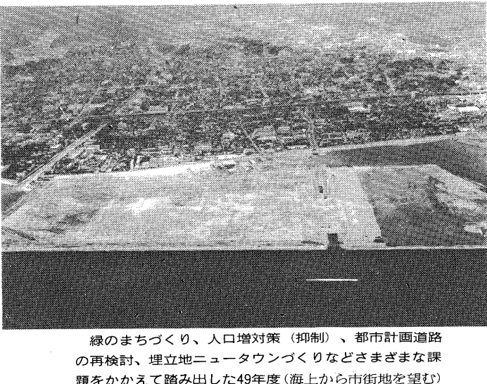
緑のまちづくり、人口増対策(抑制)、都市計画道路の再検討、埋立地ニュータウンづくりなどさまざまな課題をかかえて踏み出した49年度(海上から市街地を望む)

四月一日から、市役所本庁舎三階の下水道部下水道課業務課および下水道工事課と一階の市民部経済課は、市役所本庁舎南側の旧精道幼稚園跡へ移りました。したがって、水洗化工事に関すること、商工・農政関係、消費者行政、労働農業委員会などについてのご用の方は、そちらへおこしてください。