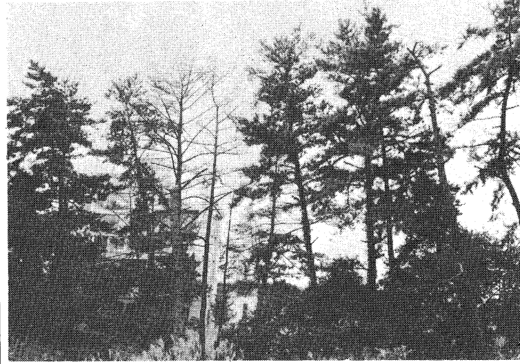
ほうっておくくと全部無しになる松林

お宅の近くに最近急に赤くなり、枯れてしまった松はありますか!! いままでは松が枯れるのは、木の寿命のほか、自然環境の変化、大気汚染や松くい虫、松毛虫等の害虫による被害で衰弱し枯れてしまったものと考えられてきましたが、最近になって松の木がマツノザイセンチュウという体長0.6ミリのメダカミキリ程度の肉眼では、ほとんど見ませんが、旺盛な繁殖力をもつ、松にとつてたいせつな樹脂、水分の通る部分を食害する線虫が発見されました。この小さな虫を運び、ばらまくのが、マツノマダラカミキリで松に寄生し、成虫となつて、松の樹内から脱出するときに、からだにマツノザイセンチュウを付着させてきます。マツノマダラカミキリは産卵までの間、盛んに松の若い枝部分を食害して、マツノザイセンチュウをばらまきます。ばらまかれたマツノザイセンチュウは、食害の傷口から松の樹内の奥深く侵入して繁殖し、松を衰弱、枯死させます。マツノマダラカミキリも、この松に産卵して翌年には成虫となり、被害を及ぼすのです。現在では、肉眼で見ると、マツノザイセンチュウを駆除することは、たいへん困難であり、運搬車であるマツノマダラカミキリの撲滅を中心とした