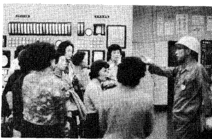
▲工場や施設の見学

あしや 一月から共同購入を始め、いま約二十人が参加。品物は、牛乳、たまご、しょう油、砂糖、米、酒、とろろ、さらだ油、野菜、果物、灯油、石けん、トイレトペーパーなど。また、一か月に一回、代表者による