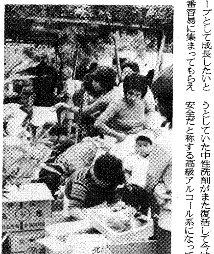
▼市内の公園での共同購入

でもらっている」が、「つけ合せの野菜」なども高値で困っているというので、その世話もという声各地で盛りあがったので今の業者に協力してもらっています。