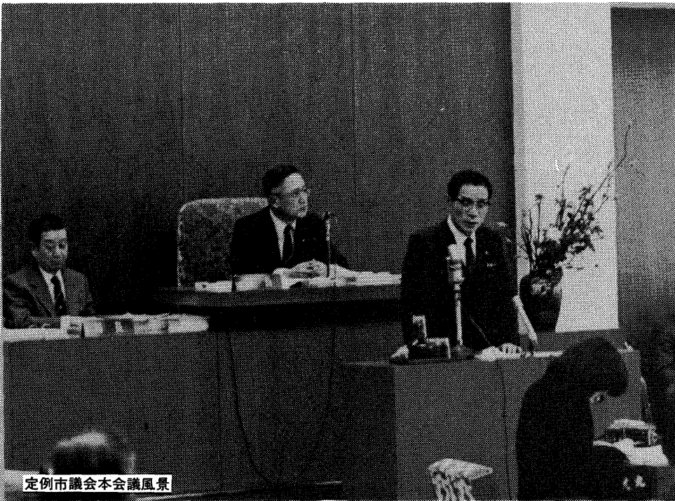
定例市議会本会議風景

第二回定例市議会は、三月八日から三十日までの会期二十三日まで開催しました。冒頭、市と市教育委員会は、新年度の施政方針を明らかにし、市議会各会派代表六議員が総括質問を行いました。この外、昭和五十九年度各会計予算や条例の制定、一部改正など三十六議案を審議しました。その結果、住民票等の交付手数料や市営住宅使用料値上げ案など五件は、結論を見送りました。