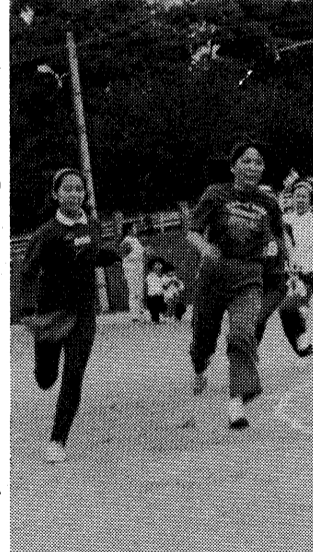
昨年の運動会風景 リレーは競技の花。グループの期待を担って大ハッスルの婦人

市民センターや体育館を活動の場として、現在、たくさんの方が文化、スポーツ活動に親しんでいます。婦人運動会は、これらのグループが年に一度、一堂に会して楽しく汗を流し、親交を深めるために開催して今年で十九回目を迎えました。昨年は二十七団体、五百人を越える参加がありました。年齢も二十歳代から八十歳代まで幅広く、 プログラム作成にも一苦勞です。運動会の企画は、体育指導委員(社会体育指導の勉強をされた主婦)を中心にグループの代表たちが作成。当日の召集や整理係など八つの係も交替で担当する、市民の手づくりの運動会です。 大声の声援あり、大笑いの演技あり、日ごろのストレスはいつべんに解消します。一般参加も前もって申し込みがあれば一人でも参加できます。家でジツとしているあなた、のぞいてみませんか。