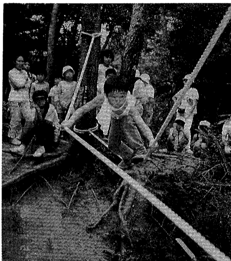
青少年野外活動センターで

「家族の人と相談して自分の家の手伝いを決めて、最後までがんばりぬこう」。これは、B校の呼びかけです。身のまわりの整理・整頓や後片づけは、自分