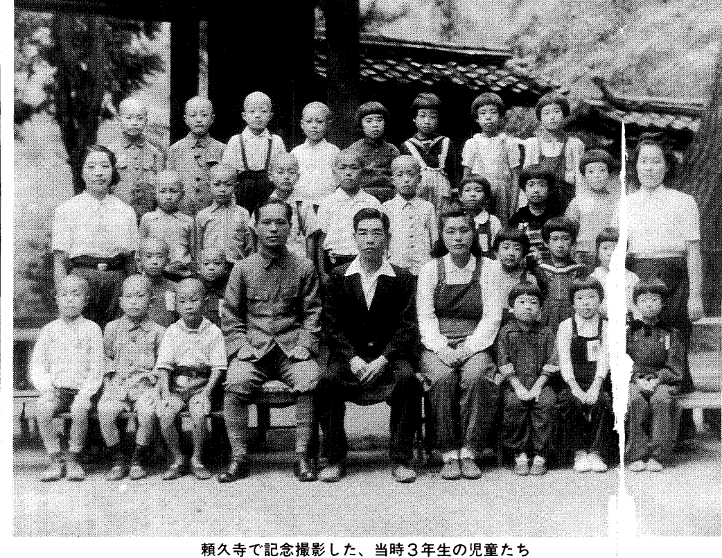
頼久寺で記念撮影した、当時3年生の児童たち