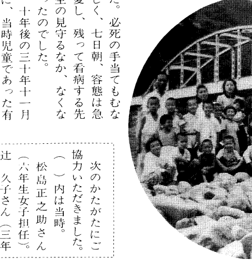
近くの川で泳ぎました(高梁川の河原で)

八月十五日は終戦記念日です。著しい夏がくるたびに、戦争の悲惨さ、平和の尊さをかみしめます。本市では、六十一年「非核平和都市宣言」を行い、核兵器の使用と核戦争を防ぎ、この美しい自然を、次代の子供たちに残す決意をしています。戦争は、子供たちに深い傷跡を残しました。十六年、小学校は国民学校と改称され、戦時体制の教育がなされました。太平洋戦争末期、戦局は厳しくなり、日本各地で空襲を受け、疎開先を探して、集団疎開したのが「学童疎開」です。本欄では、精道国民学校(精道小学校)の、当時の教師、親児童が、その「戦争」とどのように必死に闘っていたかを振り返ってみたい。