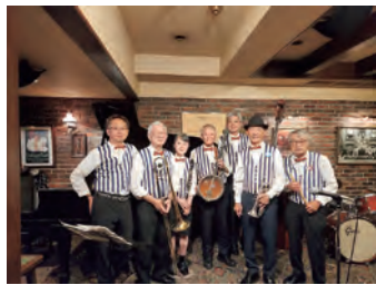
ロイヤルフラッシュ

■日時 12月14日(日)午後2時～3時30分■定員 先着100人■出演 ロイヤルフラッシュ■料金 当日券1,200円(前売り券1,000円)■会場&申し込み&問い合わせ 潮芦屋交流センター☎25-0511(午前9時～午後5時30分<水曜日除く>)/✉aca-event@npa-aca.jp