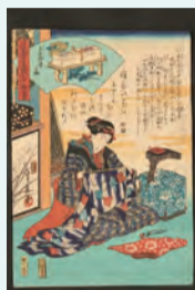
長谷川貞信『浪花自慢名物尽玉露堂扇』19世紀個人蔵

■日時 12月21日(日)午後2時～3時 ■会場 講義室 ■定員 先着60人 ■講師 深田智恵子氏(大阪くらしの今昔館・学芸員) ■料金 要観覧料 ■申し込み 直接会場へ