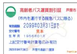
高齢者バス運賃割引証(阪急バス)