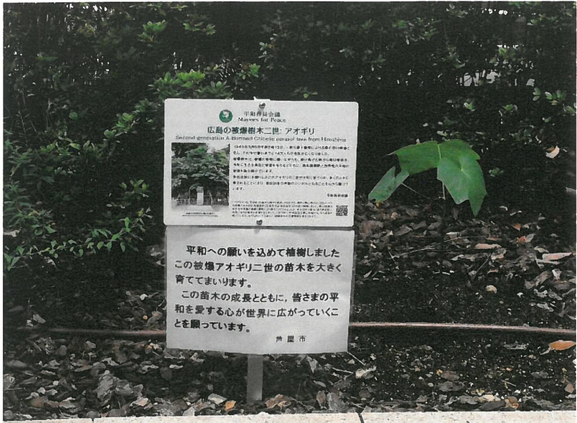
被爆樹木アオギリ 2世植樹（平成29年5月2日） 場所：芦屋市役所本庁舎東館北側緑地