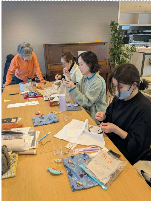
③（生後すぐの赤ちゃん連れや、妊娠中の方も参加されています）