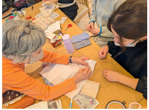
②（一人一人の興味やペースに合わせて指導いただいています）