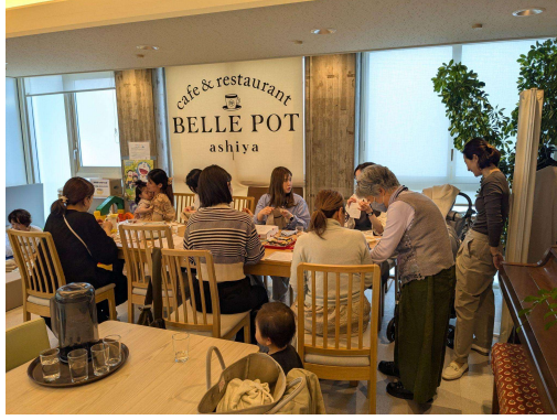
①（刺繍をきっかけにたくさんの方々が集まっています）