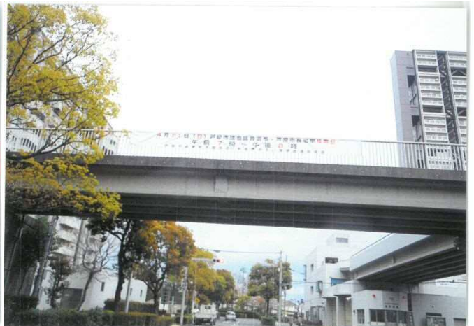
芦屋浜ダイエー前