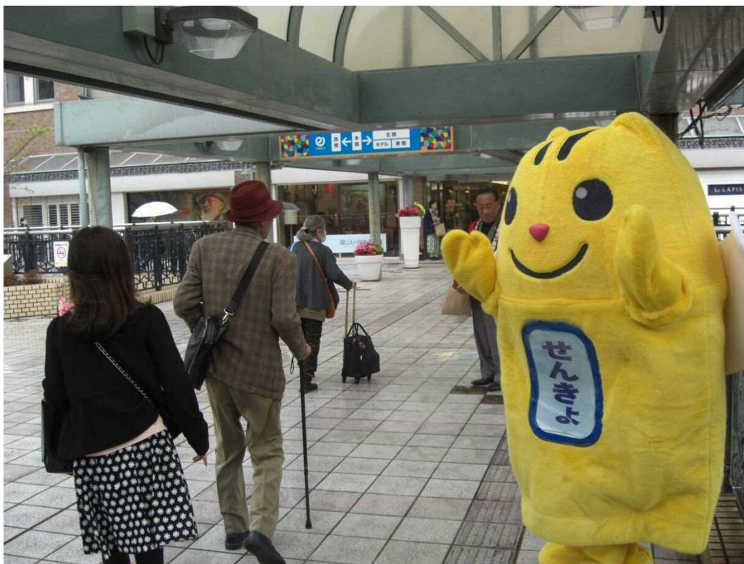
「選挙のめいすいくん」の着ぐるみを使った啓発の様子