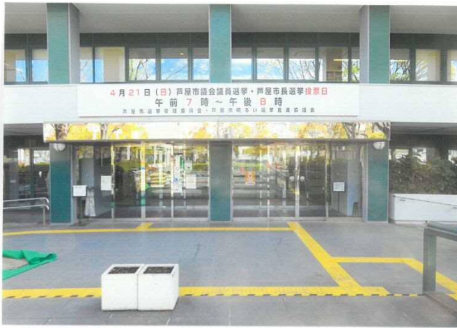
市役所北館玄関上