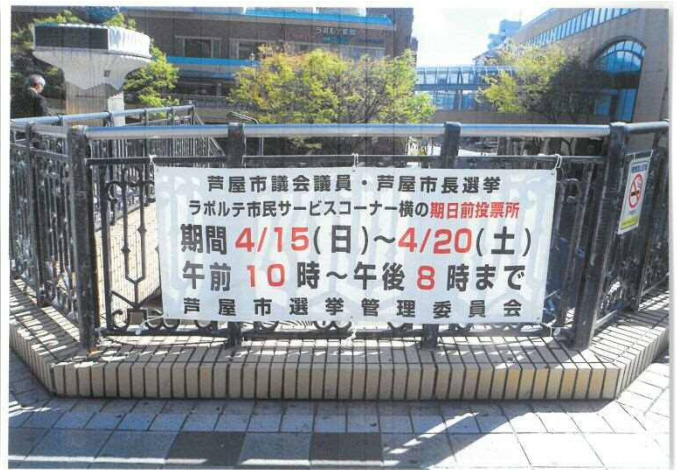
ラポルテペデストリアンデッキ②