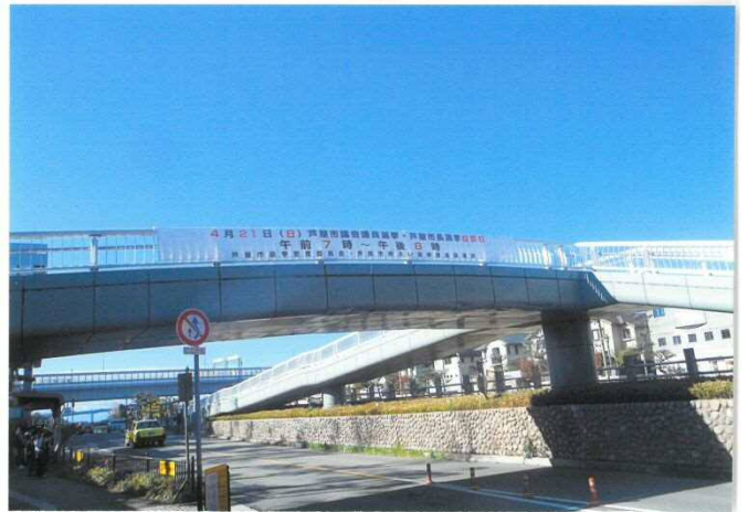
市庁舎西側歩道橋