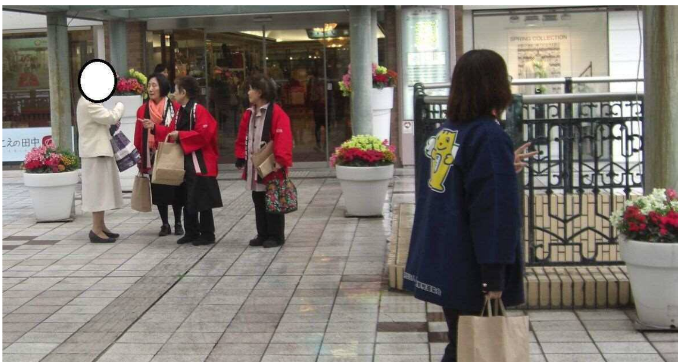
明推協委員らによる啓発グッズ配布の様子