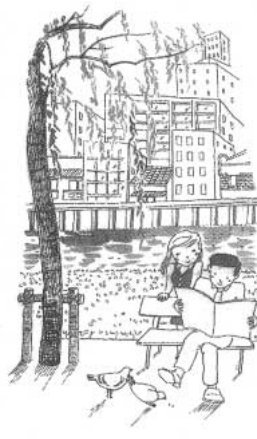
…質問 A …答弁

十二月定例会では、十二月十三日（月）、十四日（火）の二日間、十六人の議員が市政に関する三十七項目の内容について、通告順に質問を行いました。その一部を紹介いたします。