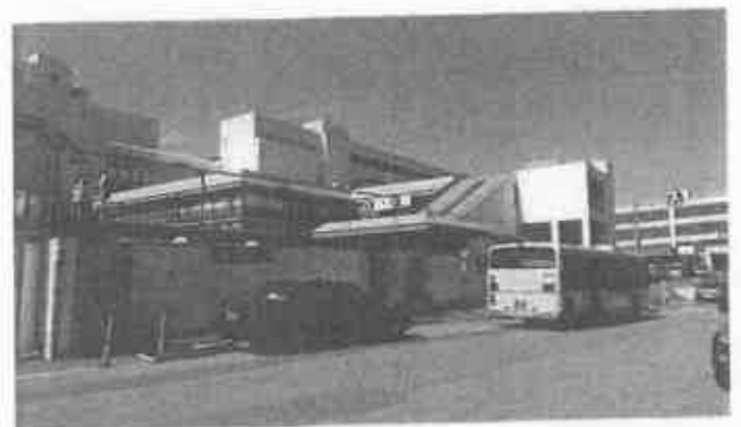
JR 芦屋駅南のようす(2020.6撮影)

これから12月までの間、JR 芦屋駅南地区再開発事業調査特別委員会を中心に、アフターコロナや市の危機的な財政状況をしっかりとチェックしつつ、調査し判断して参ります。